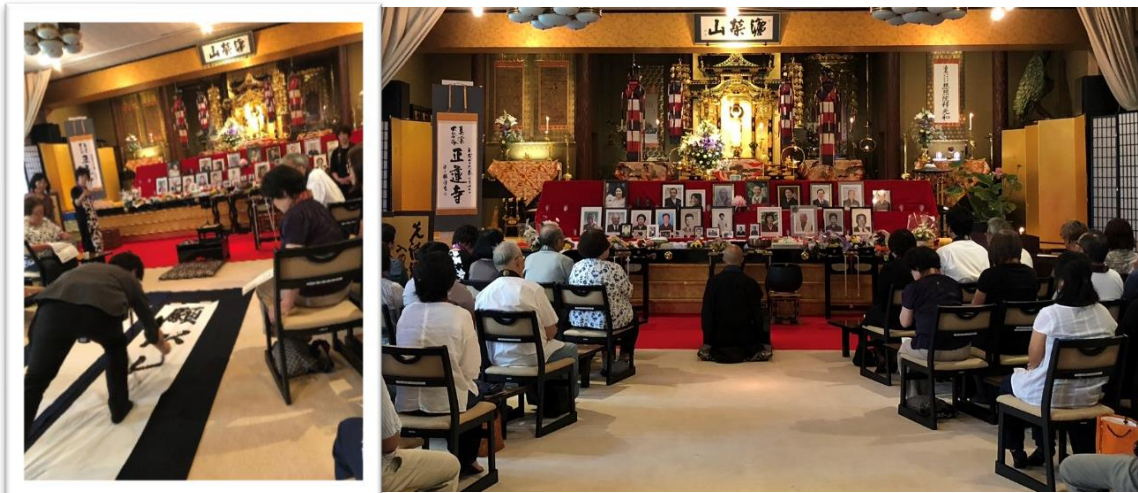
毎年参詣者が増えています。

持ち物 ・お数珠 ・お花(切り花ではなく花束で。花瓶の用意はありません。どんな花も可) ・遺影(もしくは位牌・過去帳など) (お供物・お布施は記名の上、当日、ご本尊にお供えください。) (当日不参加の方は事前にお送りください)