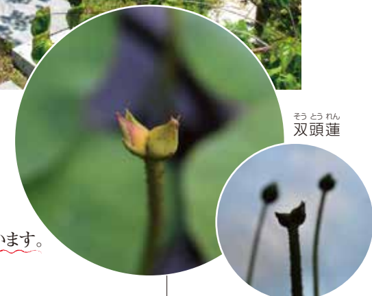
そうとうん 双頭蓮

平成二十七年に開苑以来話題の「はすのさと」墓苑。現代の様々なニーズに合わせ、一般的な墓地区画だけでなく、合理的・経済的な永代供養墓、個人墓、樹木葬が用意されています。それぞれの御家族の事情に合わせ様々な納骨スタイルから自分たちにあったお墓を選べるのが魅力です。90cm角の区画なら、墓地、墓石全て込みで100万以内の御予算で建立が可能と、コスト面でも安心です。また、明るく開放的な苑内は、四季折々の植物溢れる公園のような環境になっており、お墓をお探しの方だけでなく、植物がお好きな方も一見の価値ありのスポットです。