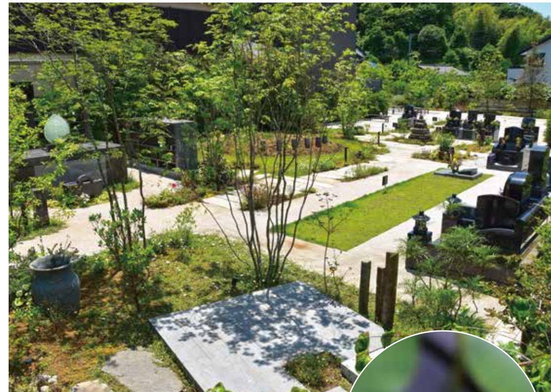
一見庭と見間違えるほど緑あふれる苑内。家族構成に合わせて様々なスタイルを選べるのも魅力のひとつ。